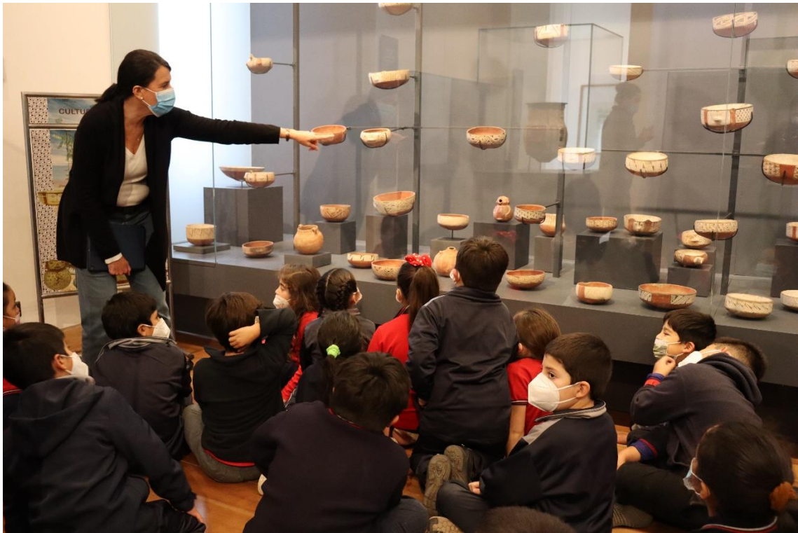
Visita pedagógica de estudiantes al Museo Andino