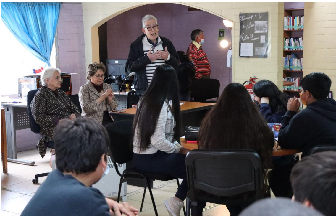
Voluntarios Adultos Mayores guiando la Academia Literaria Juvenil