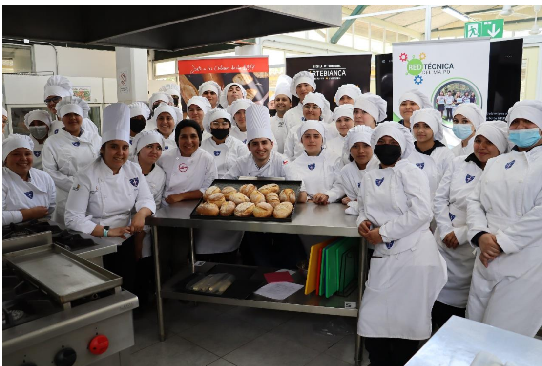
Estudiantes de Gastronomía participan en cursos de capacitación con certificaciones