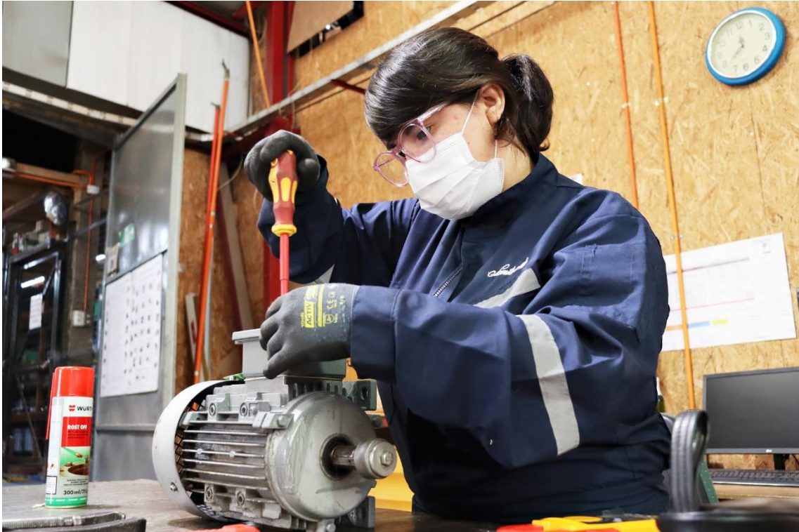
Estudiantes Técnico Profesional en Pasantía en empresas socias CEM