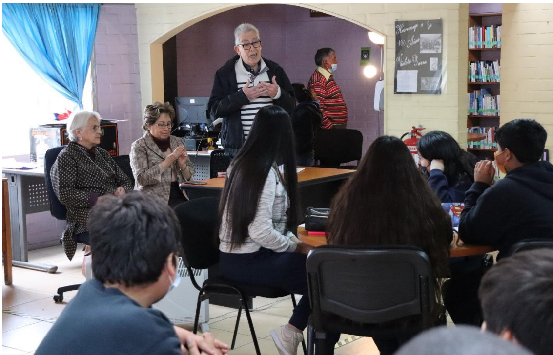
Voluntarios Adultos Mayores guiando la Academia Literaria Juvenil