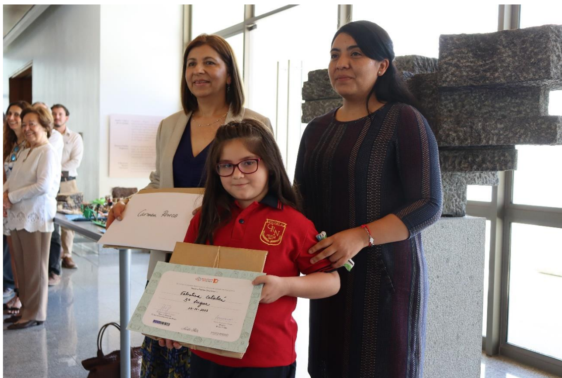
Premiación Concurso Maipo más Cerca de la Cultura en Museo Andino