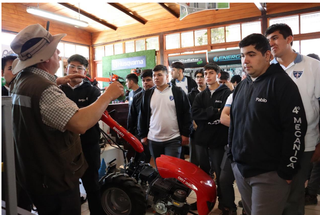
Visitas pedagógicas de estudiantes Técnicos Profesionales a empresas locales