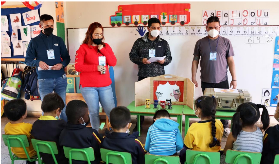
Voluntariado del Taller cuentacuentos fomentando el gusto por la lectura