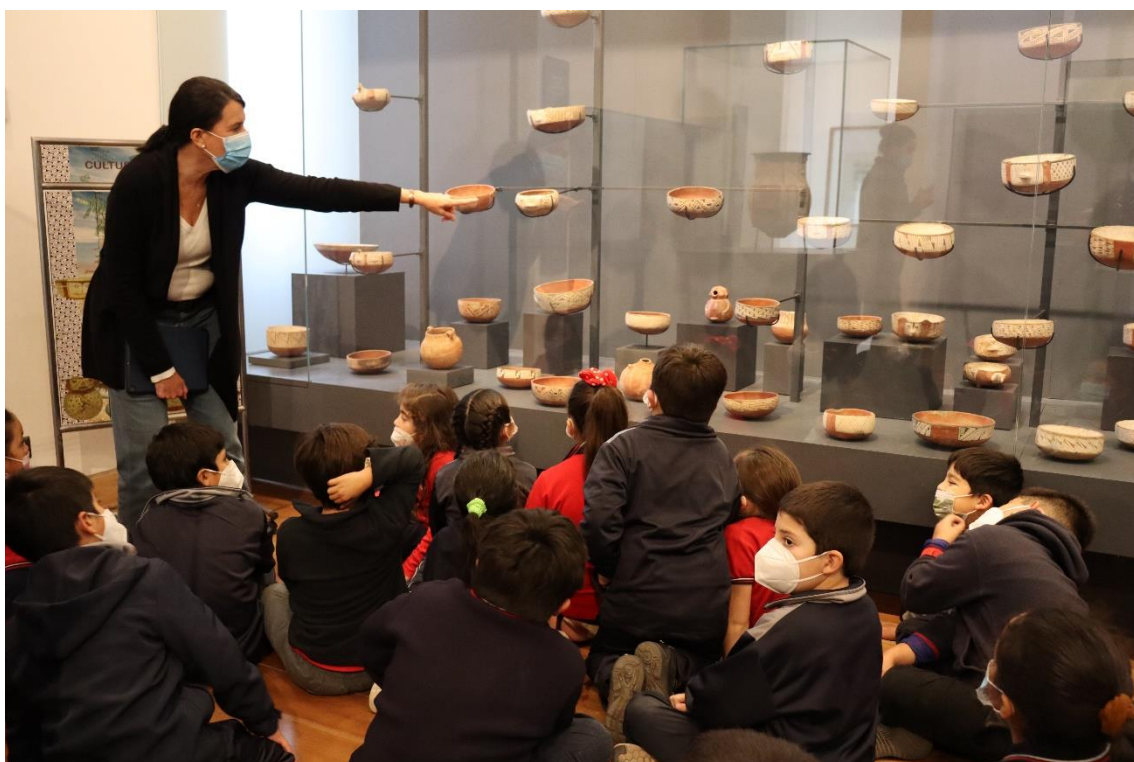
Visita pedagógica de estudiantes al Museo Andino