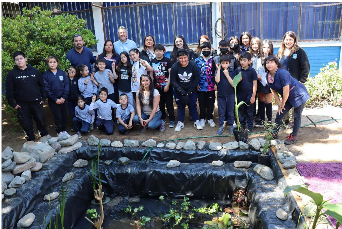
Comunidad educativa implementando un biotopo acuático en su establecimiento