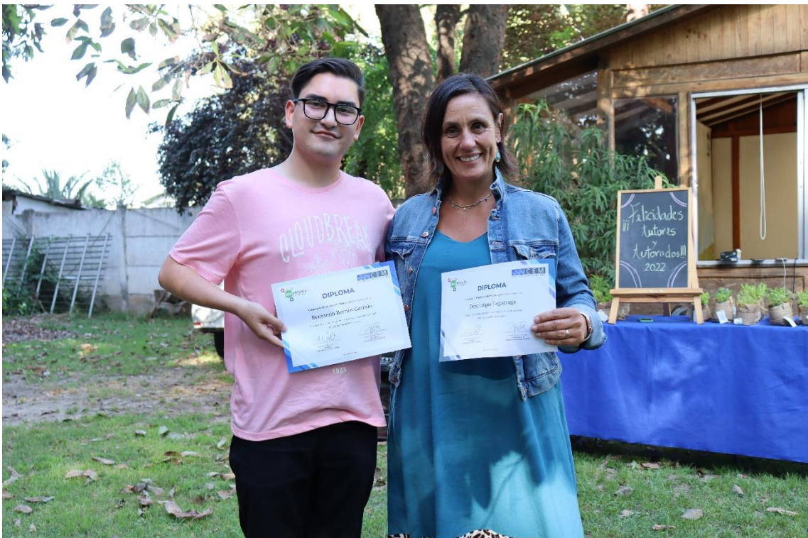
Dupla Tutorado- Tutor al finalizar el año de trabajo en su discernimiento vocacional